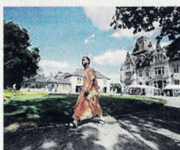
Au centre Radhadesh.

a un potentiel énorme. En septembre prochain l'Awex va d'ailleurs à Delhi pour faire la promotion du tourisme wallon et de notre centre. Actuellement, 98 % des 80.000 touristes Indiens qui viennent en Belgique restent sur Bruxelles et la Flandre. Il y a moyen d'attirer 5 fois plus de touristes indiens en Wallonie dans les 10 prochaines années », conclut notre interlocuteur, uruguayen d'origine converti à l'hindouisme à 18 ans en France. Au château de la Petite Somme, on trouve un